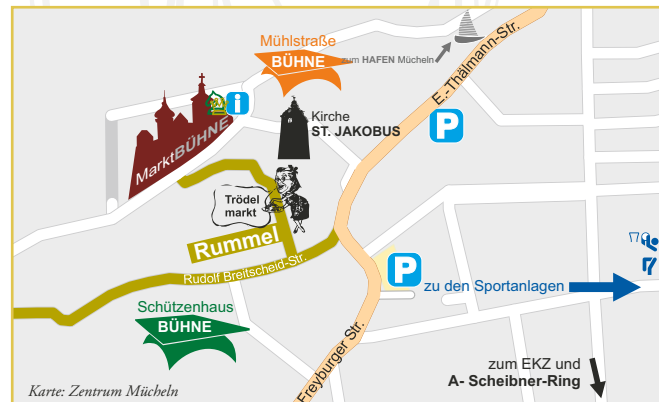
Karte: Zentrum Mücheln

Änderungen im Programmablauf sind möglich, wir bitten Sie um Verständnis!